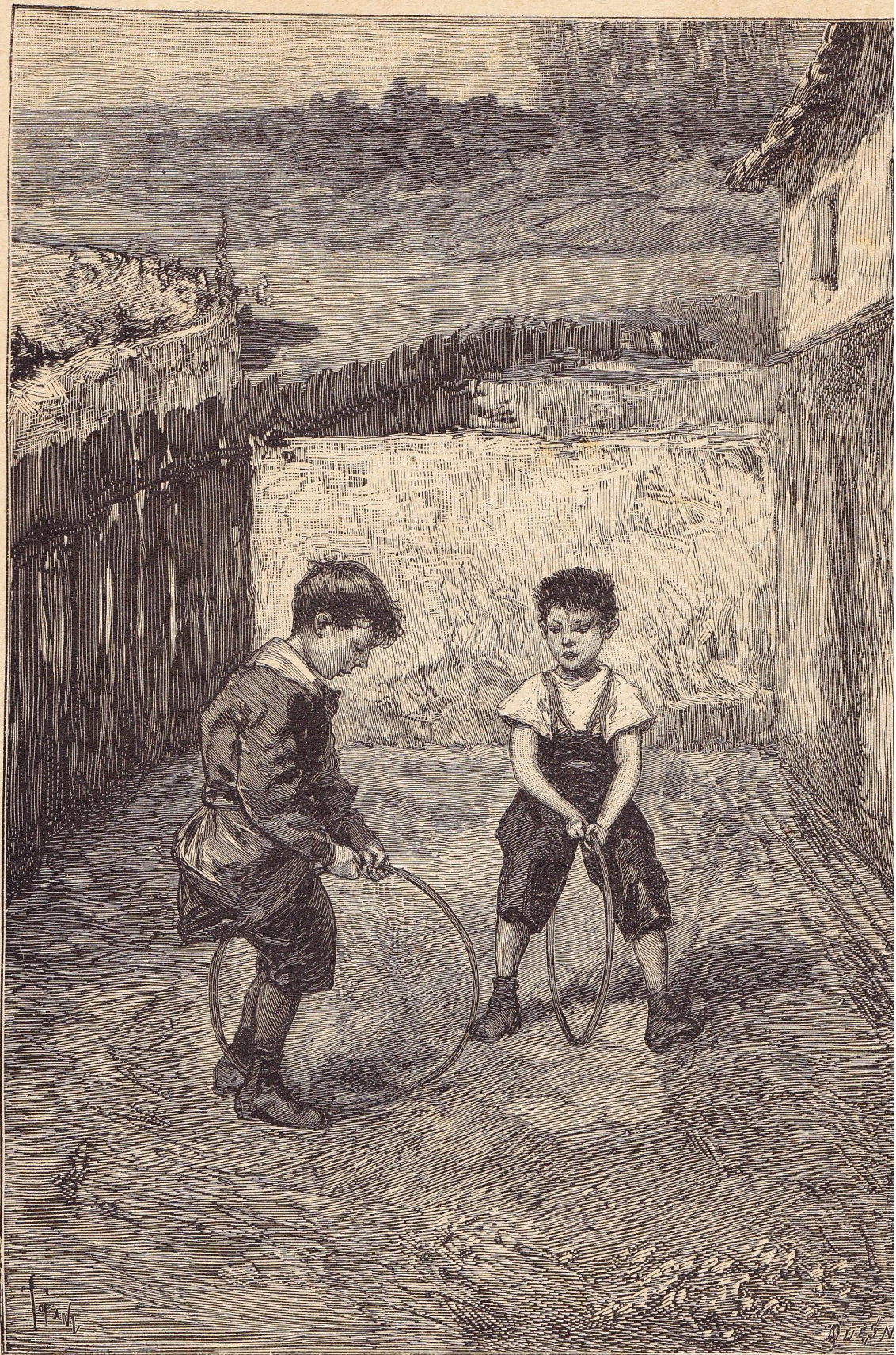
Twee kinderen die met tonreepen speelden.